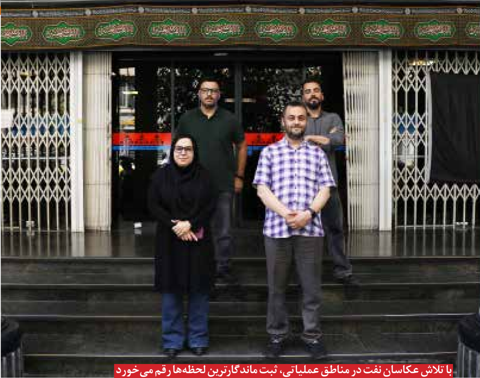
با تلاش عکاسان نفت در مناطق عملیاتی، ثبت ماندگارترین لحظه‌ها رقم می‌خورد