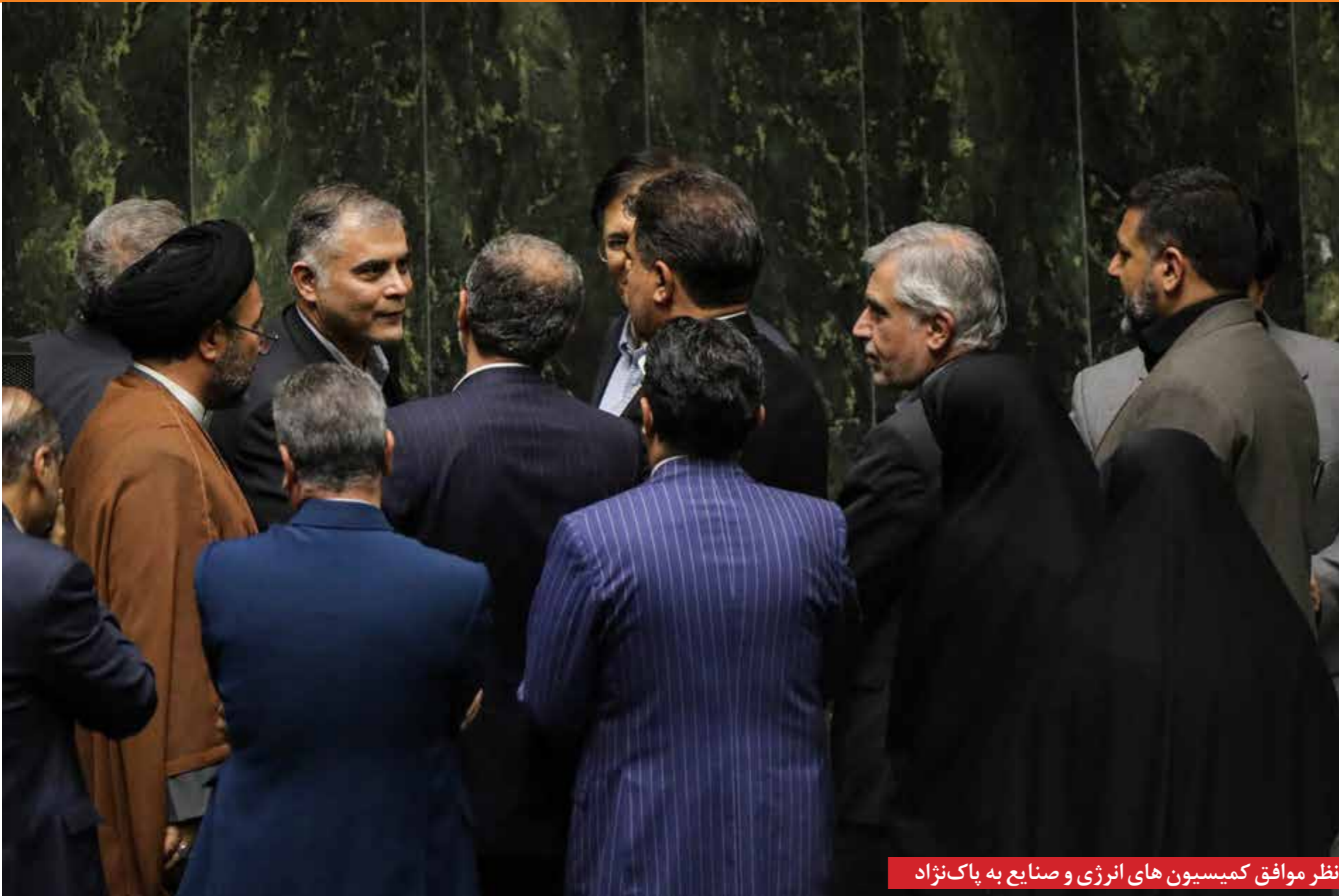
نظر موافق کمیسیون های انرژی و صنایع به پاک‌نژاد