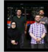
نفت و عکاسی