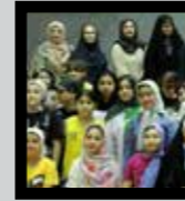
زنان و خانواده