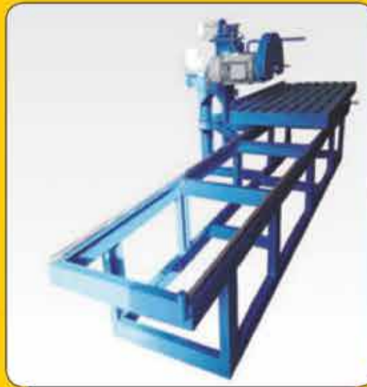
دستگاه سنگ بری در مدل های مختلف