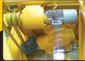
میکسر: افقی با ظرفیت نیم متر مکعب با گیربکس طرح Z-۵۰۰ و الکترو موتور ۳۰ اسب