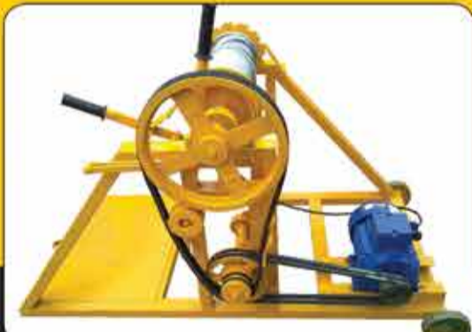
بالا بر زمینی طرح ترکیه ای ۳۰۰ الی ۵۰۰ کیلو