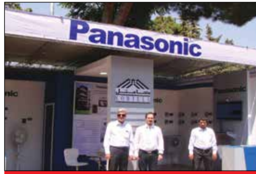
شرکت کامتل - جنوب میدان آلمان (فضای باز سالن ۳۸)