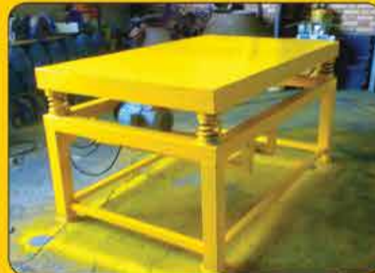
میز ویبره تکفاز و سه فاز