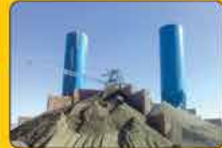
سیستم باسکول ها: شن و ماسه ۱۵۰۰ کیلوگرم با قابلیت اندازه گیری ۴ نوع مصالح به هر اندازه