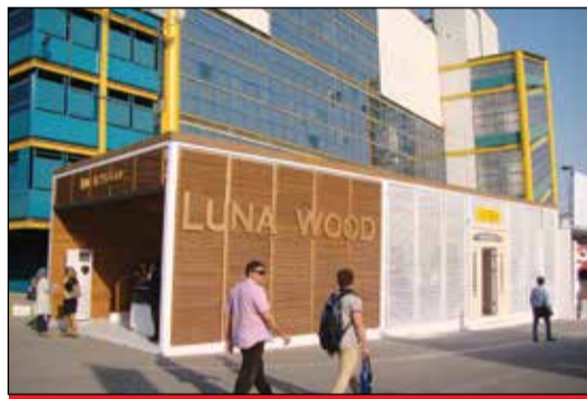
لوناوود - فضای باز سالن ۳۱