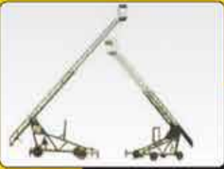
نردبان کشویی ۱۲، ۷ و ۱۶/۵ متر