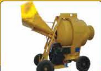
بتونیر طرح وینگت ۸۰۰ برقی و دیزل