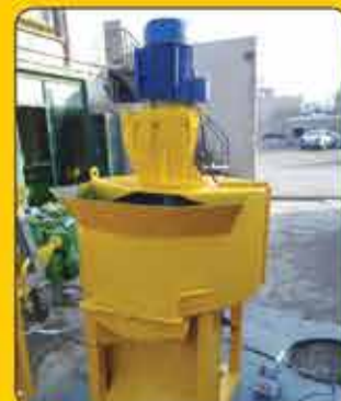
ناری ساز (میکسر) ۳۰۰ و ۵۰۰ لیتر