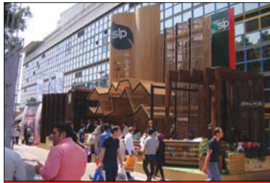
پارند رستار - جنوب سالن ۳۱