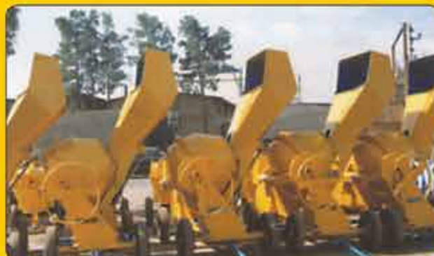
بتونیر ۵۰۰ لیتر نیمه هیدرولیک برقی و دیزل