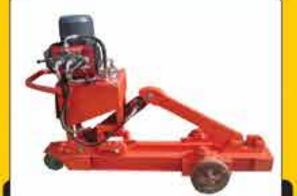
قیچی خمکن میلگرد تک فاز تا ۲۵ میلیمتر