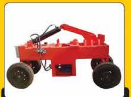
قیچی خمکن میلگرد سه فاز تا ۳۲ میلیمتر