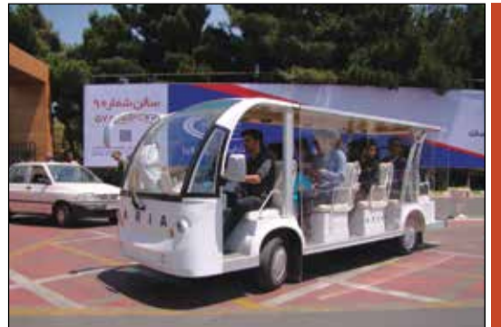
شرکت آذرخش - سالن ۳۸