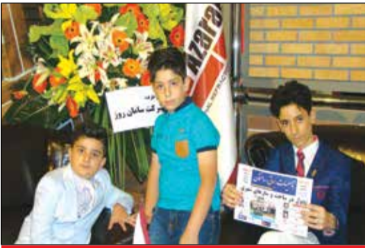
شرکت آذرخش - سالن ۳۸