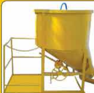
باکت های بتن و خاک ۵۰۰ الی ۳۰۰۰ لیتر