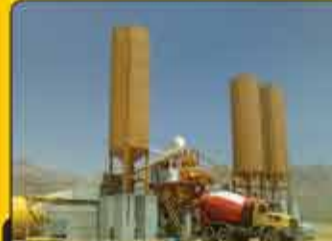
دستگاه بچینگ تولیدی دارای دو عدد اسکرو سیمان ۸ اینچ با طول ۷ متر میباشد