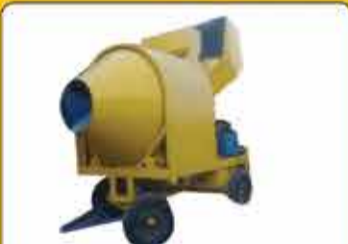
بتونیر طرح برون ۷۵۰ و ۱۰۰۰ برقی و دیزل