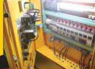
سیستم تابلو فرمان و قدرت: تابلو تمام اتوماتیک با لوازم اشنایدر با قابلیت برنامه ریزی پردازشگر دیجیتالی (سیستم PLC)