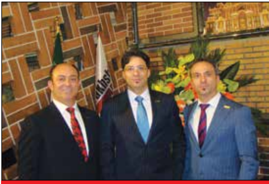
شرکت آذرخش - سالن ۳۸

تلفن: ۰۲۱-۴۴۲۳۲۷۵۹-۲۲۱۲۲۴۵۱ فکس: ۰۲۱-۴۴۲۳۲۷۵۸ نشانی: تهران - خ ستارخان - خ شادمهر - پلاک ۲۶۷ طبقه سوم وب سایت: WWW.SBP.IR/TBS.HTM ای میل: INFO@SBP.IR کانال خبری تلگرام: https://telegram.me/tbsnews لیتوگرافی و چاپ: رواق روشن مهر تلفن: ۰۲۱-۶۴۰۹۷ توزیع: پیام رسان سبز تلفن: ۰۲۱-۶۶۲۵۰۶۲۵