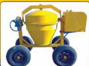
بتونیر ۳۵۰ و ۵۰۰ لیتر برقی و دیزل