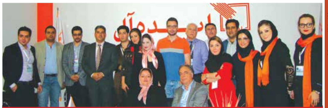
شرکت اکسیر آسا (پنجره ایده آل) - سالن ۳۵