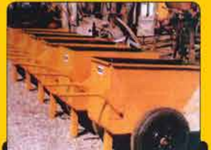
فرقون ۲۰۰ لیتر دو چرخ پیکانی