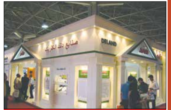
شرکت دلند الکتریک - سالن ۳۸۸