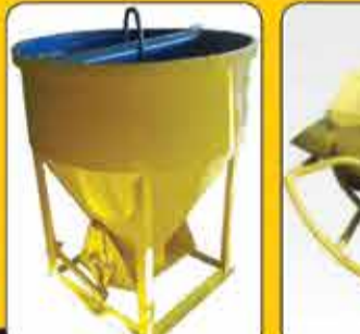
باکت بتن طرح آمریکایی ۱۰۰۰ و ۱۵۰۰ لیتر