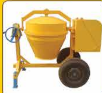
بتونیر ۱۲۰ و ۳۰۰ لیتر برقی، بنزینی و دیزل