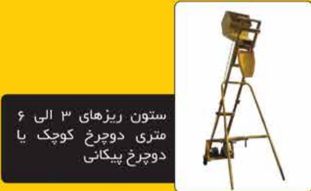
ستون ریزهای ۳ الی ۶ متری دو چرخ کوچک یا دو چرخ پیکانی