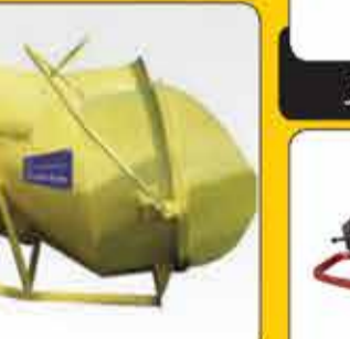
خمکن میلگرد تکفاز و سه فاز