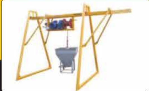
بالا بر کشویی (ریلی) ۲۰۰ الی ۱۰۰۰ کیلو