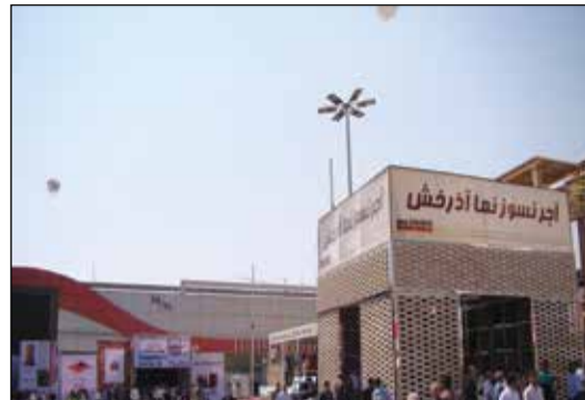
شرکت آذرخش - سالن ۳۸