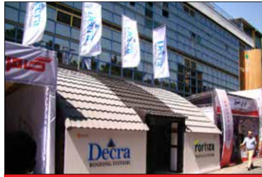
شرکت دکرا - جنوب سالن ۳۱