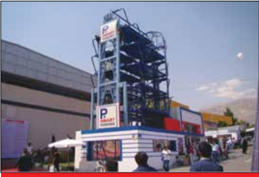
شرکت تجهیزات دانا - فضای باز سالن ۷