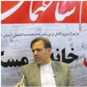
کد مطلب: ۷۸۲۳

سیاست وزارت راه و شهرسازی در عمر چهارساله دولت یازدهم بر تقویت کالبد شهری و شهروندان پایه‌گذاری شده است. به گزارش پایا سازه، عباس آخوندی وزیر راه و شهرسازی، روز دوشنبه ۱۷ آبان ماه با حضور در بیست و دومین دوره نمایشگاه مطبوعات از غرفه پایا سازه بازدید کرد و به سؤالات خبرنگار ما پاسخ داد و در رأس تمام امور در بخش مسکن ثبت بازار به‌عنوان نیاز اصلی این حوزه را مطرح کرد.