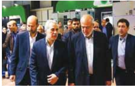
چیت چین: مجموع بدهی های صنعت برق از ۳۲ هزار میلیارد تومان به ۲۲ هزار میلیارد تومان رسید

فلاحیان در پاسخ به این سؤال که ظاهراً هفته گذشته نمایندگان مجلس از انحلال شرکت توانیر خبر داده‌اند، آیا این خبر صحت دارد یا خیر، گفت: هیچ برنامه‌ای برای انحلال توانیر وجود ندارد. وی گفت: مجلس و دولت در تعامل با یکدیگر برنامه‌ریزی کرده‌اند تا مابه‌التفاوت قیمت تمام‌شده و فروش تکلیفی برق تأمین شود. به‌طوری‌که دولت بعد از شروع به کار در طول این ۳ سال کمک‌های شایانی را به صنعت برق