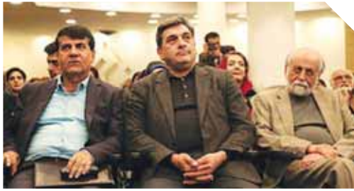
معاون وزیر راه و شهرسازی همچنین از تصویب طرح بهسازی میدان توپخانه تهران خبر داد

پیروز حناچی نیز در سخنانی باین بیانیه که با چالش افول کیفیت در زندگی شهری مواجه بودایم گفت: گزارش‌های شورای عالی