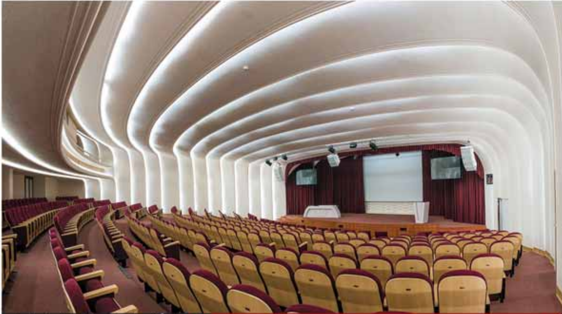
سالن آمفی تئاتر بیمارستان قلب شهید رجایی