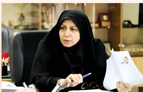
مدیر کل صنایع نساجی و پوشاک با بیان اینکه برای توسعه

نمایندگان مجلس شورای اسلامی در جلسه هیأت میره انجمن مطرح فرمودند: