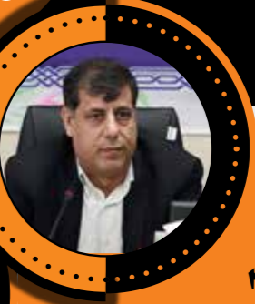
بومی سازی نزدیک به ۳ هزار گالنی نفت