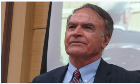
بالای ۹۵ درصد صنعت نساجی کشور در اختیار بخش خصوصی است و به دلیل قدمت بالای صنعت نساجی در کشور و بومی بودن آن از صدها